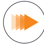
Auto-Tracking mit 2 Achsen-Gimbal