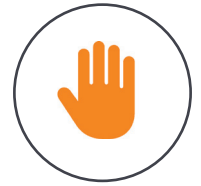
Magische Gesten- steuerung