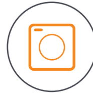
1/2.8", 8M Pixel